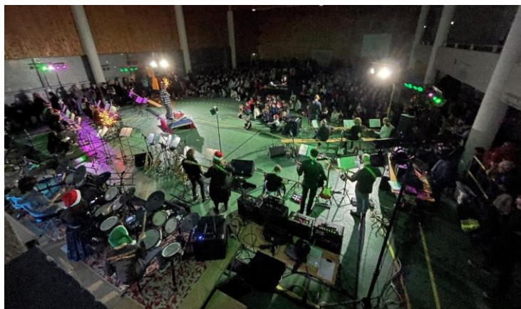
Scène et public de L'arbre de Noël le 17 décembre 2023